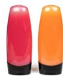
Stoffen in verpakking: Verpakking = voorwerp