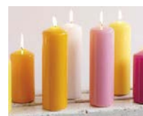
Geen voorwerp: stof of mengsel