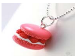
Intended release Ketting = voorwerp Geur = stof