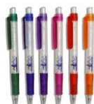
Sophisticated containers Pen = voorwerp Inkt = stof